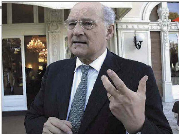
STEFANO ZAMAGNI economista riminese docente alla Università di Bologna terrà due interventi oggi e domani al teatro Titano di San Marino all'interno del "FestivalStoria" sulla politica monetaria europea che lo vede molto critico

San Marino. Oggi e domani al teatro Titano interviene l'economista Stefano Zamagni