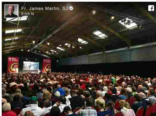
Fr. James Martin, SJ 8 ore fa

per la Comunicazione e autore di Building a bridge (edito in Italia per i tipi veneziani della Marcianum Press col titolo Un ponte da costruire. Una relazione nuova tra Chiesa e persone Lgbt e con prefazione dell'arcivescovo di Bologna Matteo Zuppi), ha commentato su Facebook la vera e propria standing ovation che è seguita alla conclusione della sua relazione sul tema Mostrare rispetto e accoglienza nelle nostre parrocchie per le persone 'Lgbt' e le loro famiglie .