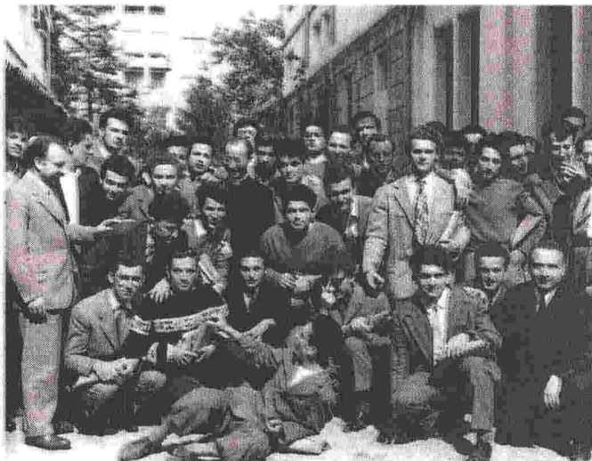
Sempre nel 1954. Ancora l'educatore con i giovani dell'incontro a Monte Velo, durante la loro visita a La Scuola Editrice nella nostra città