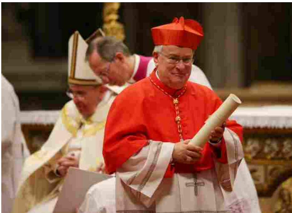
Il giorno del Concistoro in cui Gualtiero Bassetti venne creato cardinale da Papa Francesco

PERUGIA – Il cardinale arcivescovo di Perugia-Città della Pieve, Gualtiero Bassetti, è il nuovo presidente della Conferenza Episcopale Italiana. La notizia tanto attesa è arrivata nel mattinata di mercoledì, quando Papa Francesco, esaminata la terna di nomi uscita dalla consultazione che ha visto la partecipazione di tutti i vescovi italiani (che oltre la presenza del capo della Chiesa perugino-pievese, vedeva anche quella del vescovo di Novara, monsignor Franco Giulio Brambilla, e quella del cardinale Francesco Montenegro, titolare della diocesi di Agrigento), ha scelto il cardinal Bassetti come successore del cardinale