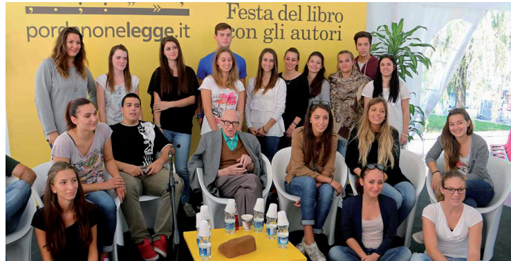
Boris Pahor con i giovani lettori a Pordenonelegge

Il libro verrà adottato in molte scuole del Nord-Est e la grande speranza di Pahor è che il testo circoli nelle scuole di tutta Italia per far comprendere ai giovani lettori gli errori della storia, i conflitti ancora aperti e come molti fatti lontani - specie della seconda guerra mondiale - non siano ancora abbastanza conosciuti. Che sia un problema ancora aperto lo scrittore ne ha dato prova durante l'incontro ricordando come alcuni suoi recenti scritti sui campi di concentramento politici (i "campi taciuti") pensati inizialmente per il "Corriere della sera", siano stati rifiutati dal quotidiano perché ritenuti scomodi.