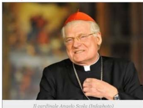
Il cardinale Angelo Scola

Potremmo chiederci se il logos che guida lo scambio intellettuale sul morire, tra il filosofo Emanuele Severino e il Cardinale Angelo Scola ( Il morire tra ragione e fede , Marcianum Press, Venezia 2014), possa essere davvero dia-logos .