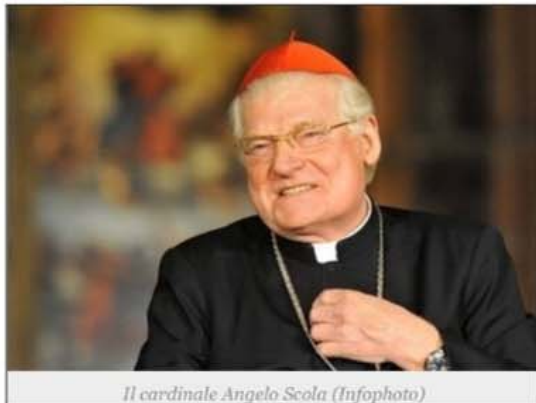
Il cardinale Angelo Scola

Su questo dilemma si snoda un corso di pensiero tecnocratico e religioso che sfida di continuo Costituzioni e legislature in Europa e altrove (non dappertutto, non ancora). Ma se siamo seri quanto il Cardinale, dovremmo riconoscere che forse ancor prima, e più profondamente, un'affermazione tale racchiude ciò che molti vorrebbero saper dominare, nell'ineludibile consapevolezza del limite che fa della passività al morire quella propria.