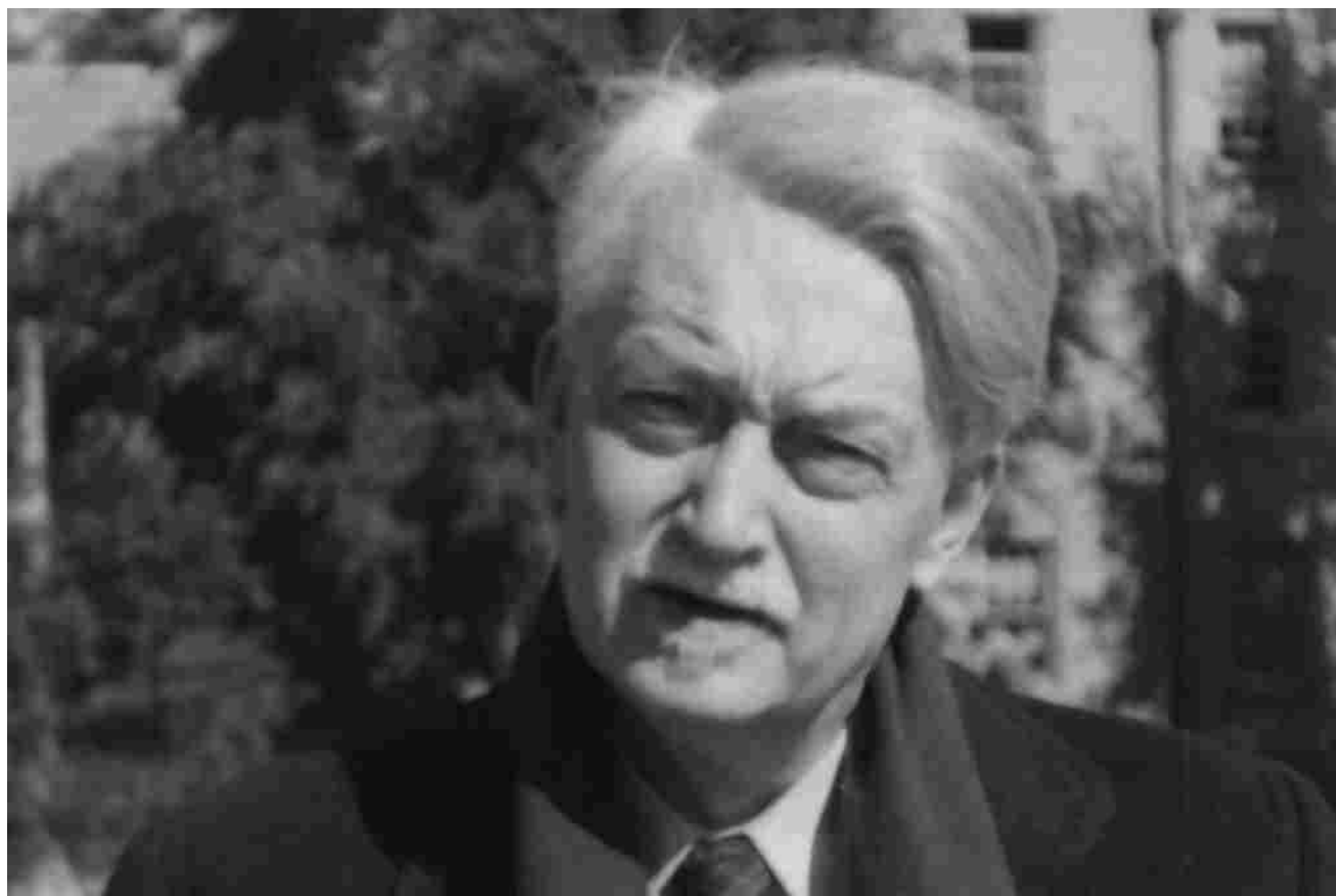
Jacques Maritain (1882–1973) - Istituto Jacques Maritain