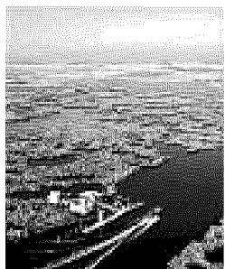
Grandi paesaggi vulcanici e

sorprendenti riprese aeree che documentano i problemi che affliggono la Terra partendo da riscaldamento globale e buco dell'ozono. Un documentario di grande impatto emotivo, che Yann Arthus-Bertrand ha girato in oltre 54 Paesi diversi. Teatro Lux via Marconi 20 Alle 21