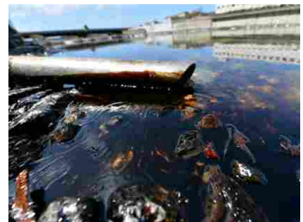
Incidente alle condutture della Iplom, impianto in Valle Scrivia