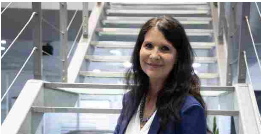
Al via Passaggi Festival a Fano: per il debutto arrivano il Ministro Valditara, Mario Giordano e Marco Materazzi