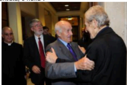
FISICHELLA COFFERATI BERTINOTTI SALUTA CARLO RIPA DI MEANA

"Non entrerà nelle questioni interpretative e politiche trattate nella prima parte del libro", ha spiegato mons. Fisichella. "L'ambito di mia pertinenza si rivolge all'importanza del dialogo e alle domande di senso che emergono da queste pagine. Sono pagine che provocano una serie di domande per il credente... e la fede ha bisogno d'interrogarsi". A tale proposito, l'arcivescovo ha citato Sant'Agostino: "La fede, se non è pensata, è nulla".