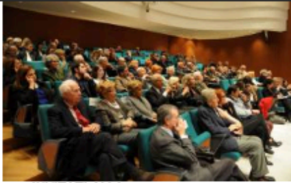
INVITATI ALLA PRESENTAZIONE LIBRO DI FAUSTO BERTINOTTI

fordismo era un processo duro ma semplice da interpretare. Quel modello oggi non c'è più, sostituito da un modello di rete meno facilmente interpretabile". Questo ha fatto sì che il cambiamento in atto venga percepito ma non governato: i vecchi partiti erano luoghi di acculturazione, i nuovi partiti non lo sono più. Il veloce cambiamento del lavoro ha comportato la caduta verticale dei diritti delle persone: "Una società dove i diritti vengono messi in discussione è una società che perde di valore". Con la conseguenza che, nella drammaticità di questa crisi, le due grandi culture a sfondo sociale e religioso sono destinate a convergere.