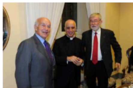
FAUSTO BERTINOTTI RINO FISICHELLA SERGIO COFFERATI

Papa Francesco: "Che cosa possiamo dire di fronte al gravissimo problema della disoccupazione che interessa diversi Paesi europei? È la conseguenza di un sistema economico che non è più capace di creare lavoro, perché ha messo al centro un idolo, che si chiama denaro!".