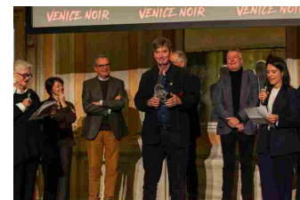
Ian Rankin è il vincitore del Venice Noir