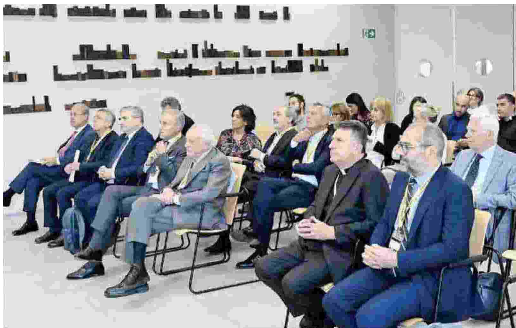
Partecipazione. L'incontro per ricordare mons. Enzo Giammancheri

■ Incontro al GdB e messa nella chiesa di San Luca per ce- lebrare la memoria di monsi- gnor Enzo. A PAGINA 31