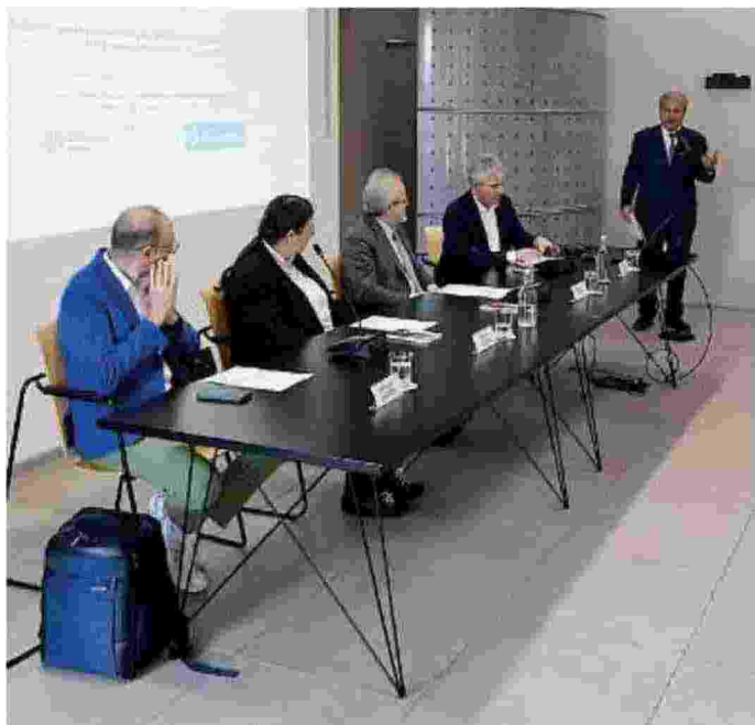
In Sala Libretti. L'evento ieri nella sede del Giornale di Brescia