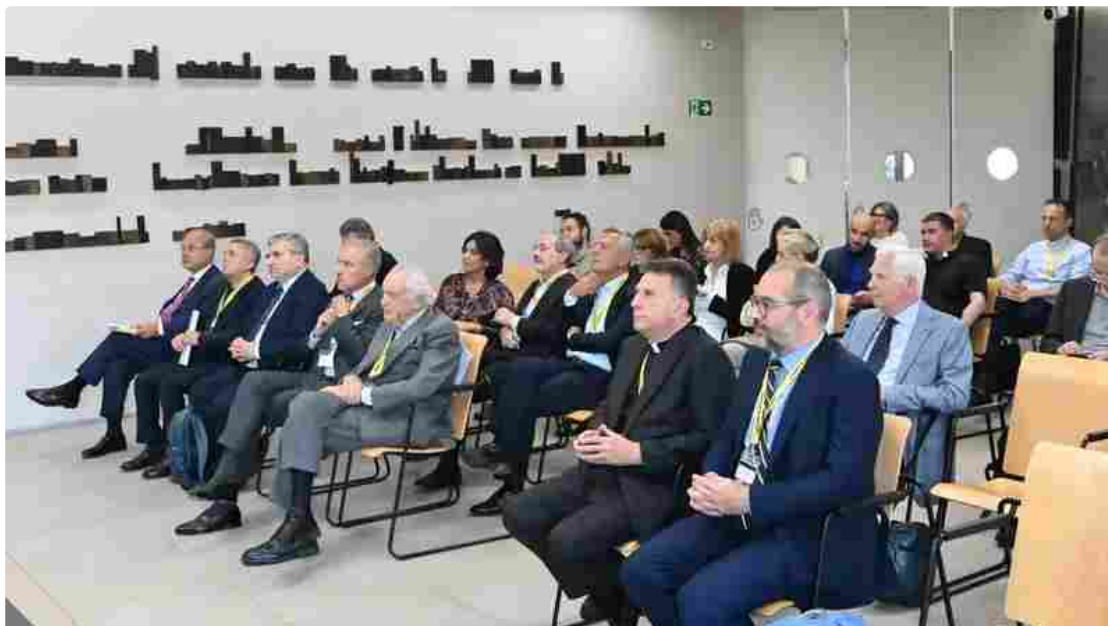
L'evento in Sala Libretti al Giornale di Brescia