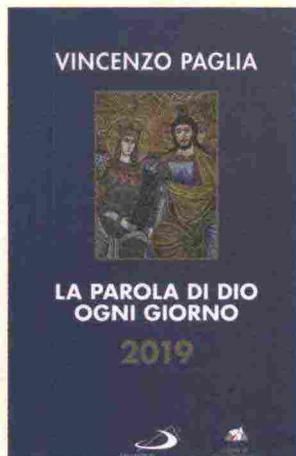
Vincenzo Paglia La Parola di Dio ogni giorno 2019 San Paolo e Sant'Egidio 2018 pp. 564, € 20,00

■ La pubblicazione è frutto di un lavoro "a quattro mani" di due consacrati, che ha origine da un monito che papa Francesco, fin dall'inizio del suo Pontificato, rivolge ad ogni consacrato: essere, nella realtà quotidiana, testimone e profeta attento e vigile di fronte agli innumerevoli interrogativi della società. Anche il card. Joao Braz De Aviz, nella sua prefazione, non manca di sottolineare questa priorità del pontificato di papa Francesco, rafforzata e sostenuta dalle sue radici vocazionali. Il desiderio che ha condotto nella stesura di questo semplice e agile strumento, è stato quello di offrire ai consacrati la restituzione non solo delle parole del Papa, rivolte ai consacrati attraverso messaggi, discorsi, documenti, ma di trovare in esse il cuore, la "perla preziosa". È una sorta di vocabolario composto da circa 200 parole. Non ha la pretesa di essere un testo esaustivo, ma vuole aiutare ogni uomo e ogni donna che ha scelto di mettersi alla sequela di Gesù ad essere sempre più persona autentica, impegnata e vivace nel testimoniare l'amore incondizionato che Dio ha per ogni persona.