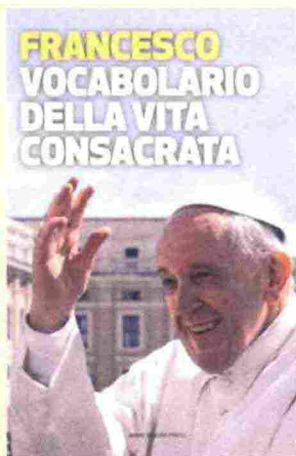
Papa Francesco Vocabolario della vita consacrata Marcianum Press 2018 pp. 214, €18,00

■ La pubblicazione è frutto di un lavoro "a quattro mani" di due consacrati, che ha origine da un monito che papa Francesco, fin dall'inizio del suo Pontificato, rivolge ad ogni consacrato: essere, nella realtà quotidiana, testimone e profeta attento e vigile di fronte agli innumerevoli interrogativi della società. Anche il card. Joao Braz De Aviz, nella sua prefazione, non manca di sottolineare questa priorità del pontificato di papa Francesco, rafforzata e sostenuta dalle sue radici vocazionali. Il desiderio che ha condotto nella stesura di questo semplice e agile strumento, è stato quello di offrire ai consacrati la restituzione non solo delle parole del Papa, rivolte ai consacrati attraverso messaggi, discorsi, documenti, ma di trovare in esse il cuore, la "perla preziosa". È una sorta di vocabolario composto da circa 200 parole. Non ha la pretesa di essere un testo esaustivo, ma vuole aiutare ogni uomo e ogni donna che ha scelto di mettersi alla sequela di Gesù ad essere sempre più persona autentica, impegnata e vivace nel testimoniare l'amore incondizionato che Dio ha per ogni persona.