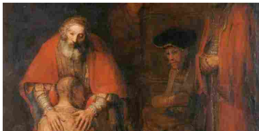
Rembrandt, Il ritorno del figliol prodigo (1668, particolare)

Sergio Arosio — Pubblicato 11 Agosto 2024