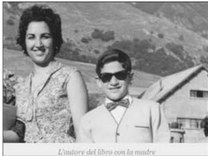
L'autore del libro con la madre

"... Ho digitato il Tuo nome e cognome su Google, come se la rete potesse darmi qualche notizia su di Te, un segnale del Tuo "esistere" nell'aldilà... perché questo prolungato silenzio? Lo so, se ce ne fosse bisogno, faresti in modo di contattarmi, magari nel sogno oppure nei discorsi e negli occhi di qualcuno che mi avvicina per caso... sei sempre stata risolutiva, concreta, capace di raggiungere l'obiettivo in maniera efficace..."