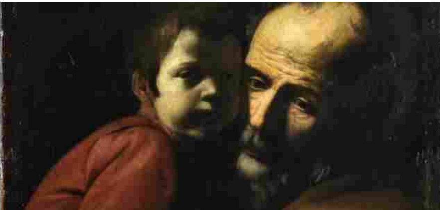
Battistello Caracciolo (1578-1635), San Giuseppe con Gesù Bambino, particolare