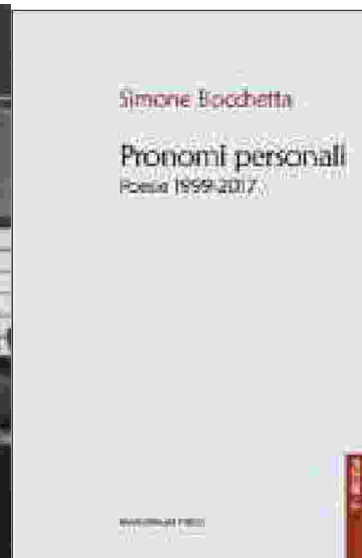
Una delle scene del film Le vertige di Marcel L'Herbier (1926). Sotto, il libro di Simone Bocchetta