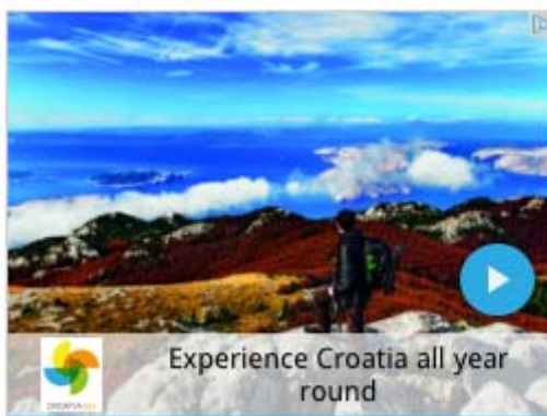
Experience Croatia all year round