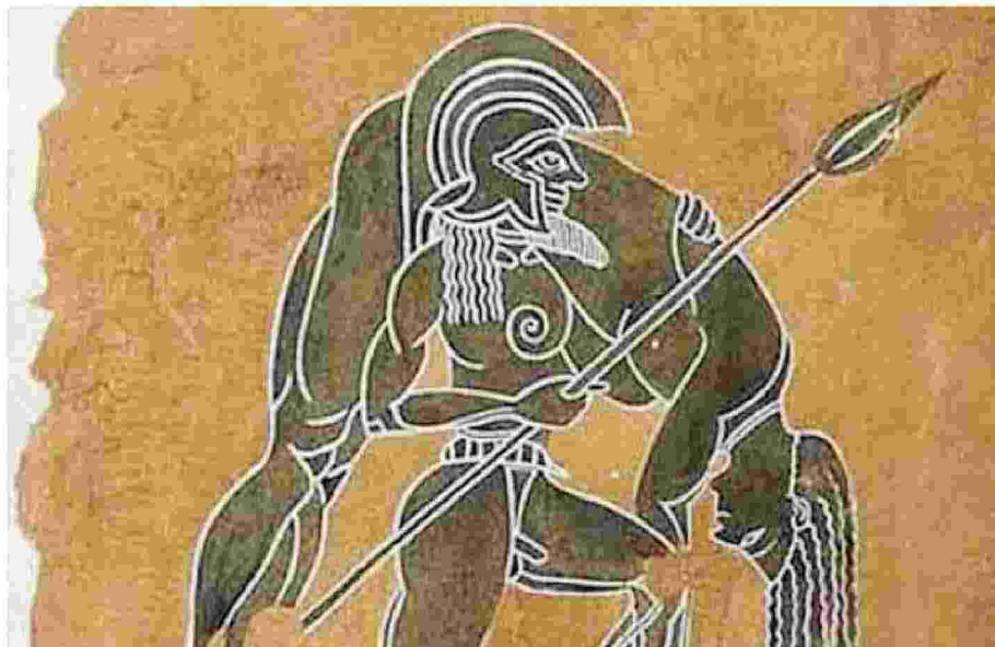
NESTORE DI PILO DURANTE LA GUERRA DI TROIA. IN ALTO LA ZATTERA DI MEDUSA DI THEODORE GENCAULT CONSERVATO AL LOUVRE