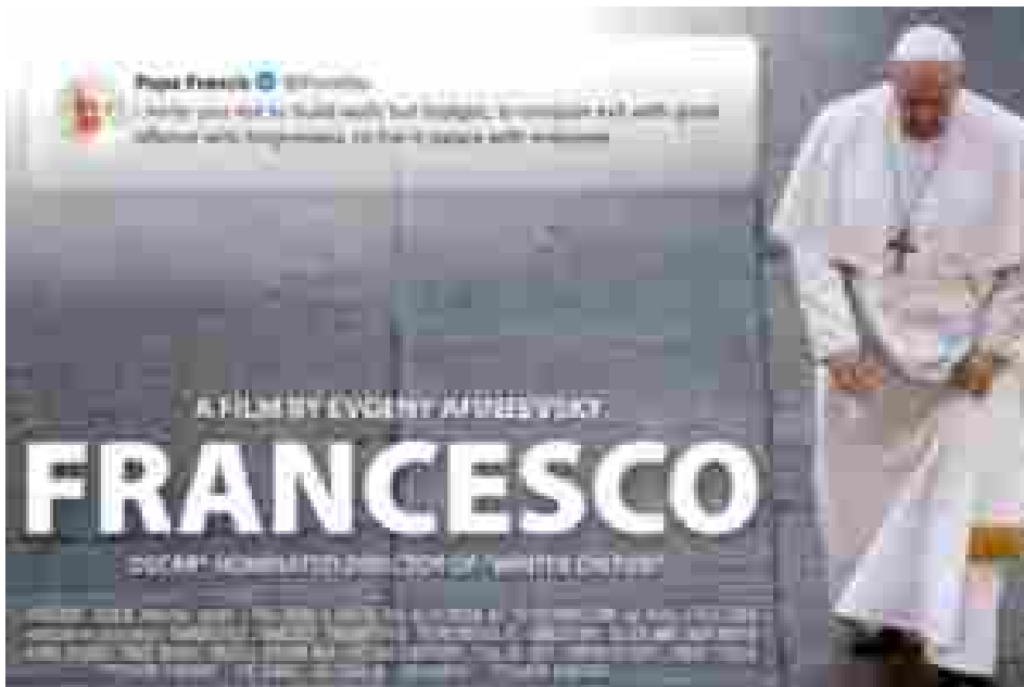
La locandina del film