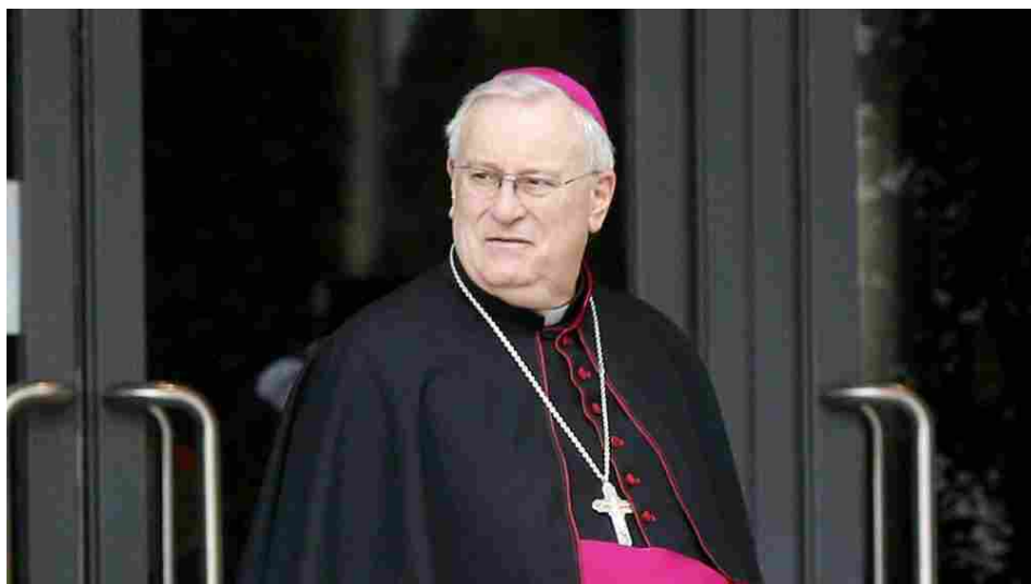
Gualtiero Bassetti in una foto del 20 febbraio 2014, prima di essere creato cardinale

«Vivere da cristiani senza carità è una sciagura». I vescovi? «Sposi della Chiesa», «Padri nella fede», «Operai del Vangelo». «Rinunciare all'autoreferenzialità e al clericalismo»