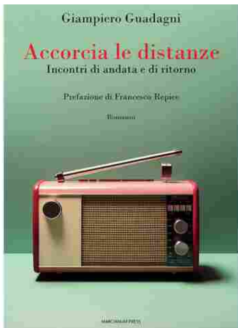
La copertina di "Accorcia le distanze"