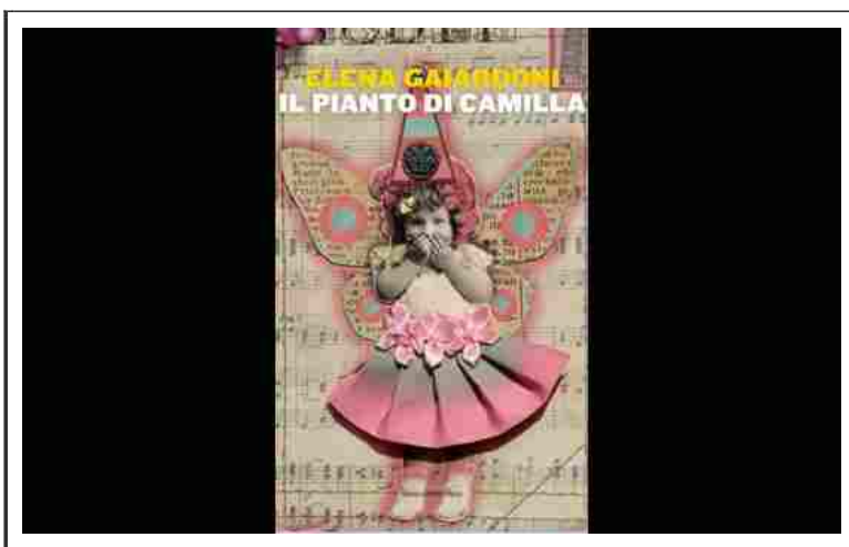
La copertina del libro