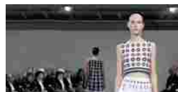
Muse d'artista nell'atelier di Alaïa