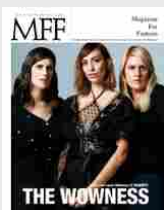
MFF 81 - The wowness