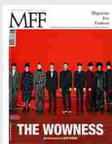
MFF 80 - The wowness