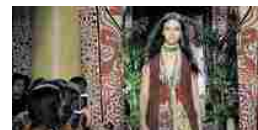
Cavalli inizia il piano di ristrutturazione