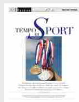
Tempo di Sport