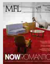
MFL 37 - Nowromantic