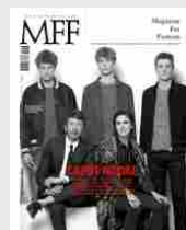
MFF 78 - Caput Modae/ House of Kors