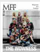
MFF 82 - The wowness