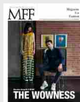
MFF 79 - The wowness