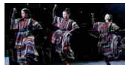
Il funky show di Kenzo x H&M