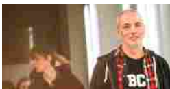
N°21 ritorna a sfilare con l'uomo E pensa al profumo