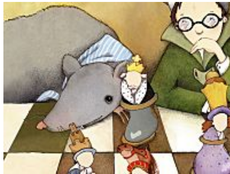
I 10 libri più amati dagli italiani su Facebook