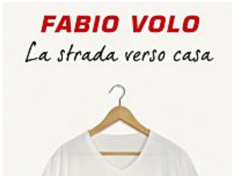
Fabio Volo, La strada verso casa