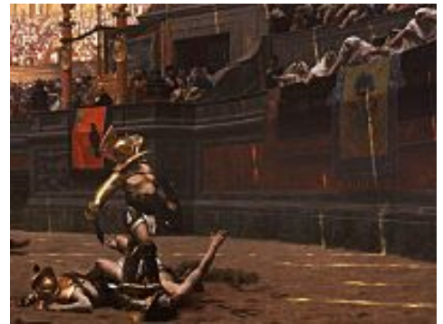
Il segreto dei Gladiatori? Energy Drink a base di cenere e tante verdure