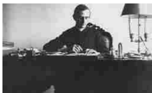
27/01/2013 Le carte del giovane Giovanni Battista Montini