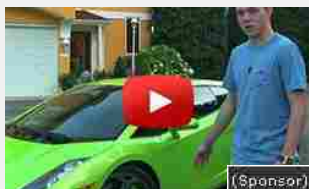
08/08/2016 Ricco con soli 1000 Euro. Come sono diventato milionario con 25000€ di entrate l...