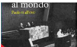
23/09/2015 «Manifesto al mondo. Paolo VI all'Onu»