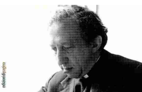
08/06/2016 Don Giussani e quelle assenti nostalgie del Medio Evo