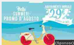
08/08/2016 Promo d'agosto BikeMi. Abbonamento annuale a 29€ fino al 31/08, che aspetti?