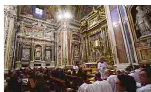
21/09/2013 "L'enigma di Maria è il silenzio dei Vangeli"