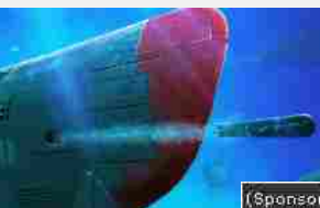
08/08/2016 Non farti beccare!!! Il tuo manager odierà questo gioco con tutto il cuore!