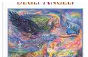
24/05/2013 Il ritorno degli angeli