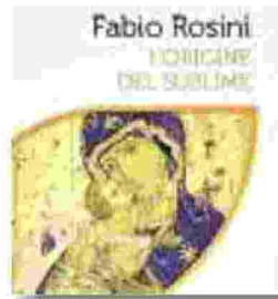
FABIO ROSINI "L'origine del sublime" San Paolo Edizioni, 15 euro

sto cristologico, che passa in rassegna la vita esemplare di Gesù, ci ricorda che solo in Lui l'uomo trova la possibilità di realizzare pienamente le proprie potenzialità, civili e spirituali, lasciandosi introdurre nel grembo dell'Amore trinitario. Il Concilio Vaticano II lo afferma con chiarezza: "Chiunque segue Cristo, l'Uomo perfetto, si fa lui pure più uomo" (Gaudium et spes, 41). Da qui nasce una convinzione che attraversa la storia cristiana: "quanto più uno è cristiano, tanto più è umano". Lo testimonia la lunga schiera dei Santi, noti e anonimi, che hanno saputo incarnare una fede capace di generare bene, trasformando la propria vita in dono e diventando autentici benefattori dell'umanità.