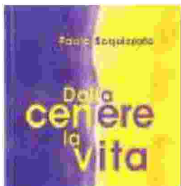
PAOLO SCQUIZZATO "Dalla cenere la vita" Edizioni Paoline, 8,90 euro

Questo è il mistero della preghiera: la varietà di parole, espressioni, posture e silenzi con cui noi e Dio restiamo in un dialogo d'amore fondato sul rispetto della reciproca libertà. Un dialogo tanto misterioso per chi crede di non averne mai fatto esperienza, quanto familiare per chi ha già imparato a immergersi con la spontaneità del cuore. Le pagine di questo libro vogliono essere un umile e utile strumento di iniziazione a un'arte di cui oggi, forse più che in altri tempi, si avverte una profonda nostal-